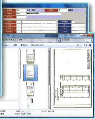
見積フォルダ管理