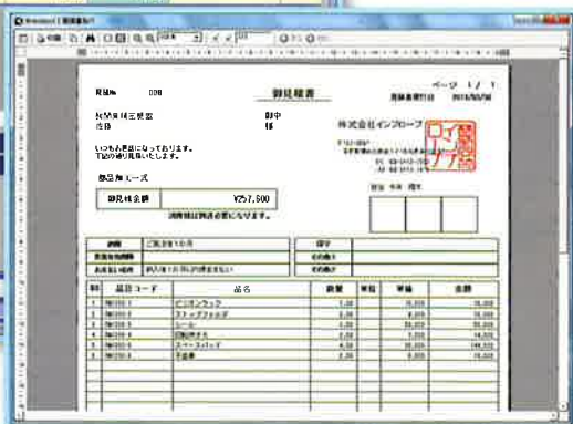
見積書発行プレビュー